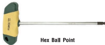
Hex Ball Point